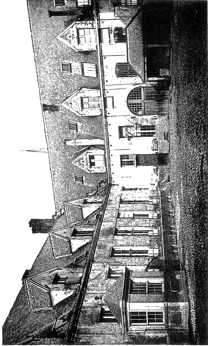
Kunstlichtdruk G. Heurnans, Antwerpen.